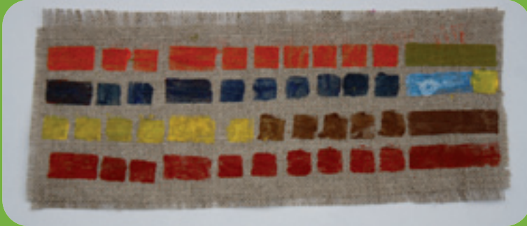
Muster von „Hänsel und Gretel“

Variation: Drucke die unterschiedlichen Tonhöhen als Muster.