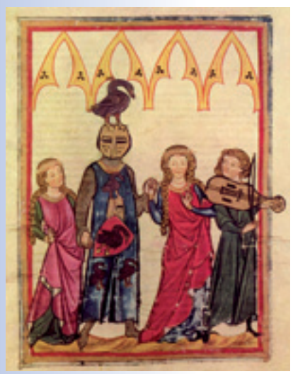
Zwei Damen zum Reigen (Meister der Manessischen Liederhandschrift)