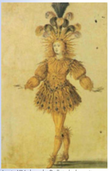
Louis XIV dans le Ballet de la nuit

Rätsel: Bringe die Tanzbilder in eine chronologische Reihenfolge