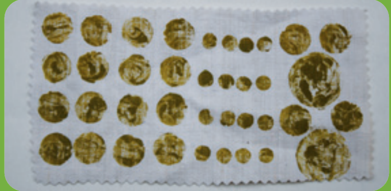
Muster von „Grün, grün, grün sind alle meine Kleider“