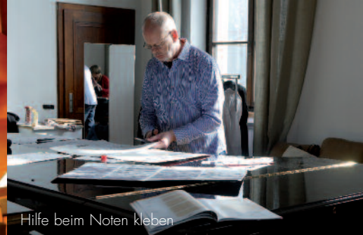
Hilfe beim Noten kleben