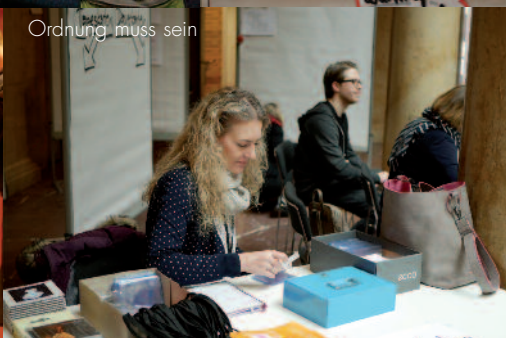
Ordnung muss sein