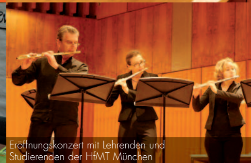
Eröffnungskonzert mit Lehrenden und Studierenden der HfMT München