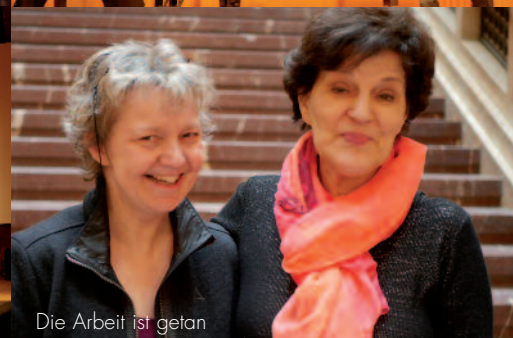
Die Arbeit ist getan