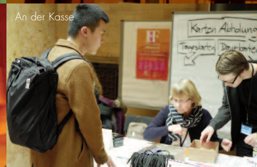
An der Kasse