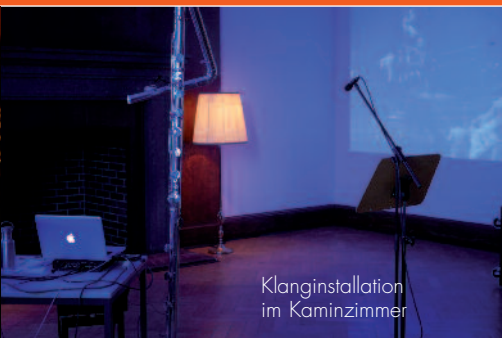
Klanginstallation im Kaminzimmer