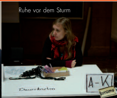
Ruhe vor dem Sturm