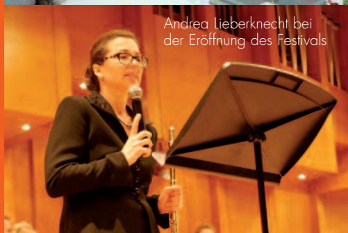
Andrea Lieberknecht bei der Eröffnung des Festivals