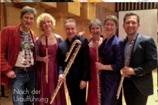
Nach der Uraufführung