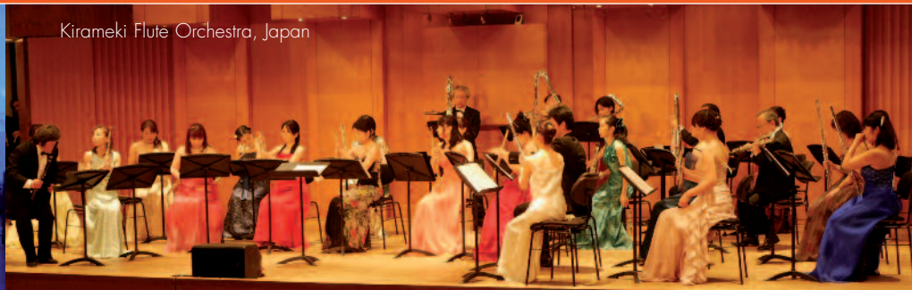
Kirameki Flöte Orchestra, Japan