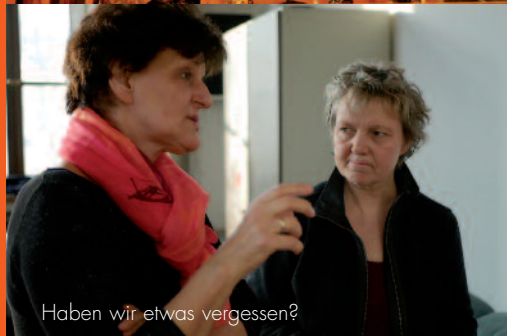
Haben wir etwas vergessen?