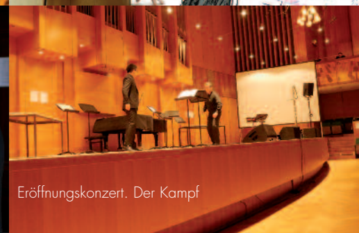
Eröffnungskonzert. Der Kampf