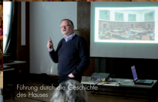
Führung durch die Geschichte des Hauses