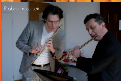
Proben muss sein